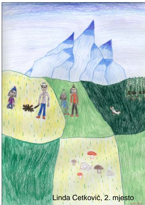
Linda Cetković, 2. mjesto

Nije lako biti mali Stariji brat uvijek krivicu Na mene svali. Ja ne smijem puno pričat' Mama odmah počne vikat' Svi su od mene jači i veći. Svi mogu sve reći. Nije lako biti mali.